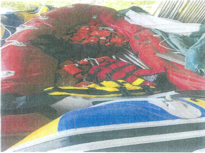
【 사진설명: 동산 기호5 】