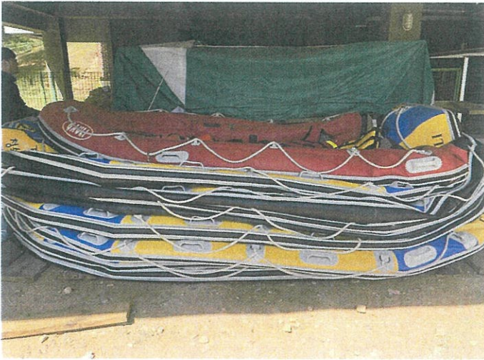
【 사진설명: 동산 기호1,8 】