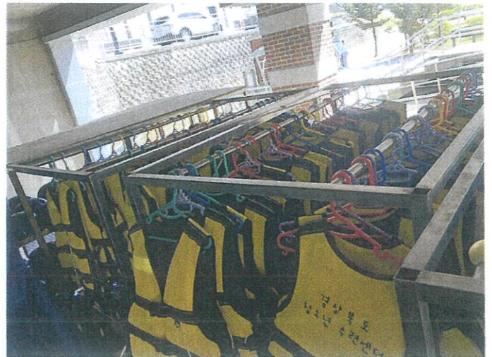
【 사진설명: 동산 기호2 】