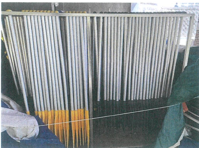
【 사진설명: 동산 기호3 】