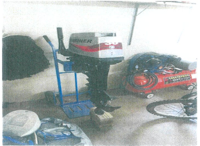
【 사진설명: 동산 기호7 】