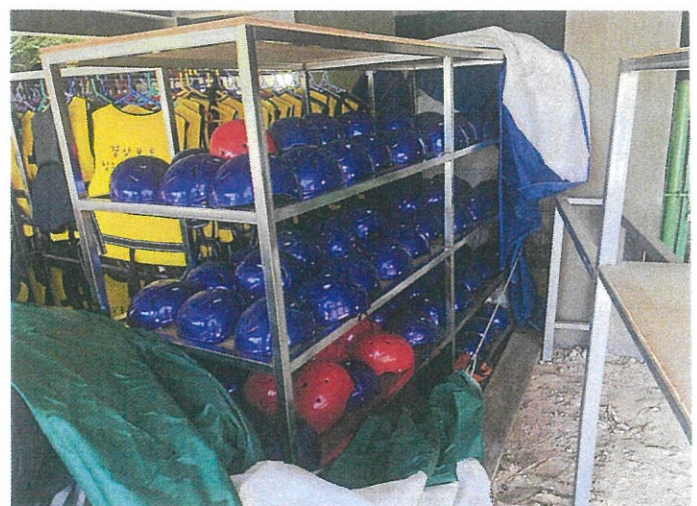
【 사진설명: 동산 기호4 】